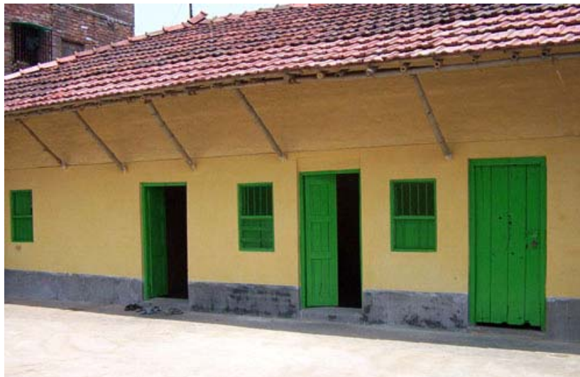
El edificio de Tara School, después de la reforma.

La ONG Seva Sangh Samiti , pone a nuestra disposición una casa en el barrio y con el compromiso por nuestra parte de los gastos de reparación de la misma, salario de profesores, material escolar, facturas de luz y demás gastos.