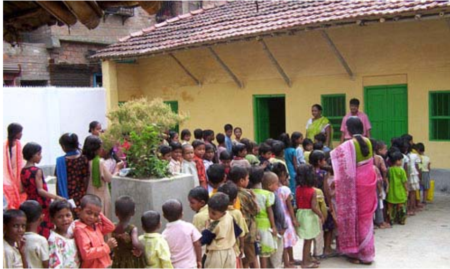
La entrada al colegio.

El colegio acoge a más de 130 niños de las familias más pobres del barrio . Entre 4 y 12 años de edad y distribuidos en cuatro cursos: preescolar, I, II, y un curso especial de alfabetización.