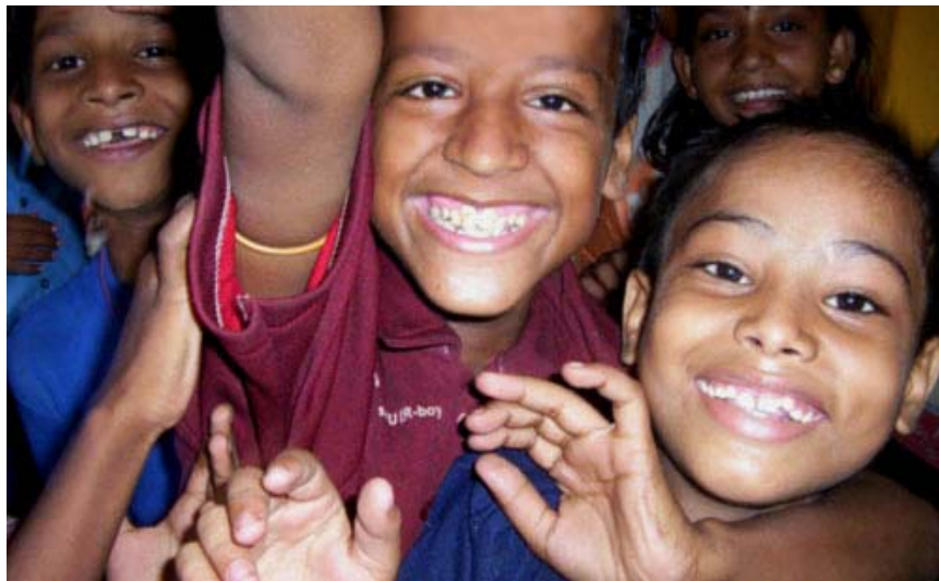
Una educación contemporánea y divertida.

El colegio acoge a más de 130 niños de las familias más pobres del barrio . Entre 4 y 12 años de edad y distribuidos en cuatro cursos: preescolar, I, II, y un curso especial de alfabetización.