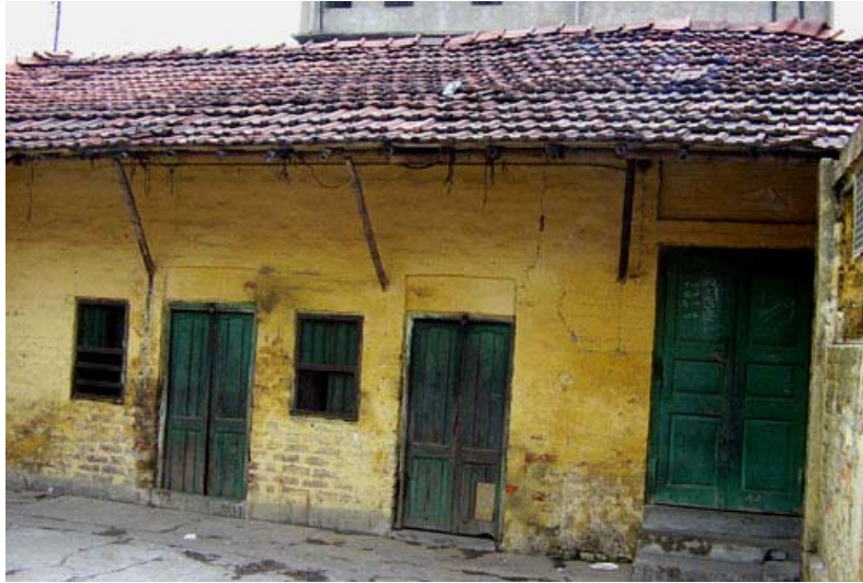
El edificio de Tara School, antes de la reforma.

La ONG Seva Sangh Samiti , pone a nuestra disposición una casa en el barrio y con el compromiso por nuestra parte de los gastos de reparación de la misma, salario de profesores, material escolar, facturas de luz y demás gastos.